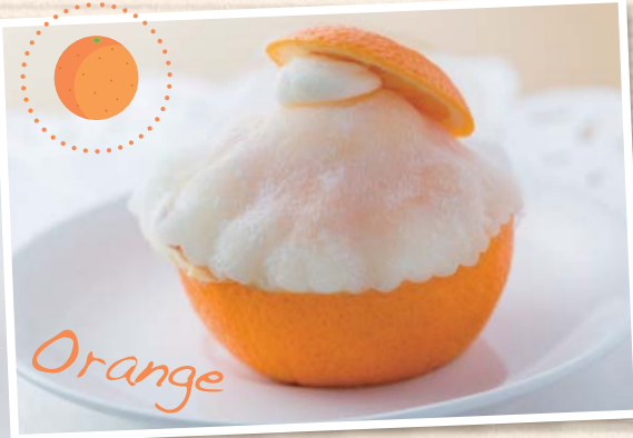
オレンジのクリーム大福

旬のいちごをたっぷり使ったタルト。コーティングされたイチゴがキラキラ輝いて、乙女心をくすぐる。クリームやタルト生地は甘さ控えめなので、いちご本来の甘みや酸味を思う存分味わって。