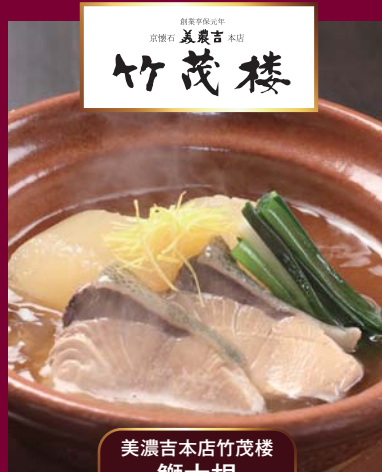
美濃吉本店竹茂楼 鯛大根