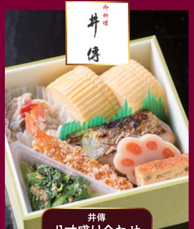
井傳 八寸盛り合わせ

【当日販売券】平成28年3月13日(日) 14:30~ (先着順、売り切れ次第終了)